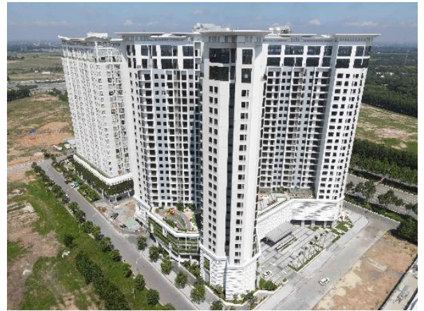
▲SORA gardens I および II