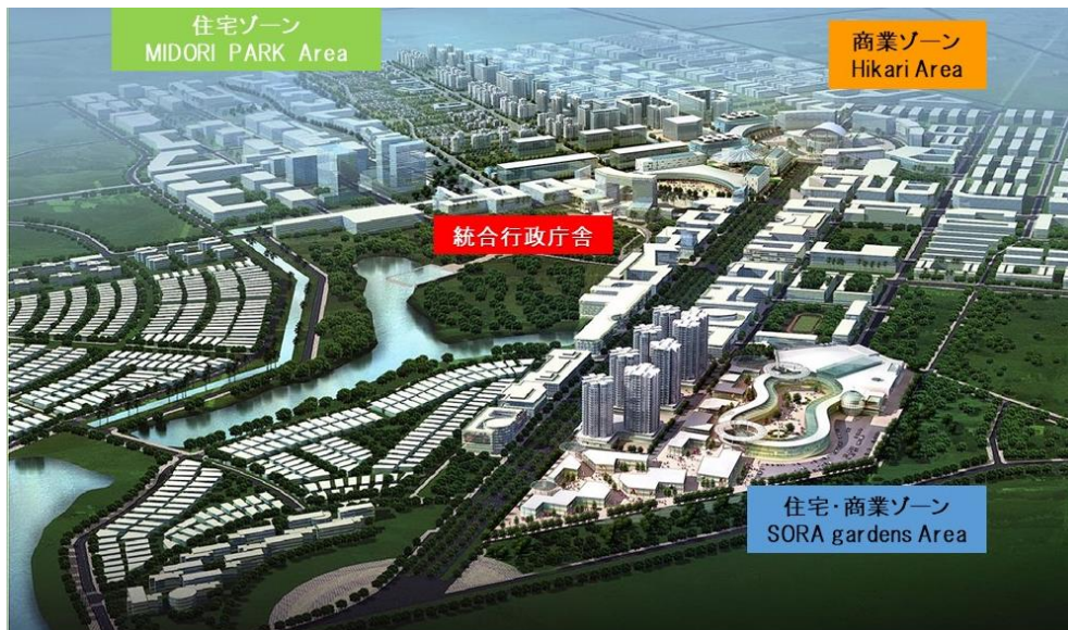
▲ビンズン新都市開発全体イメージ

東急は、2012年からビンズン省ビンズン新都市において、低層・高層住宅や商業施設からなる開発を進めています。また、2014年からビンズン新都市の公共交通機関としてバス事業を展開しています。