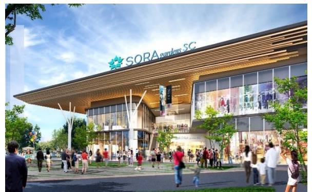
▲SORA gardens SC