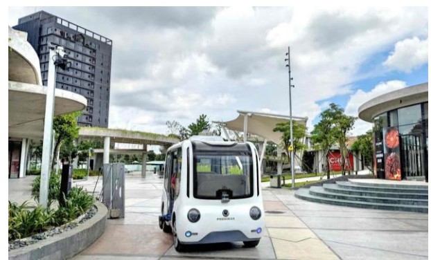
▲自動運転実証実験の様子