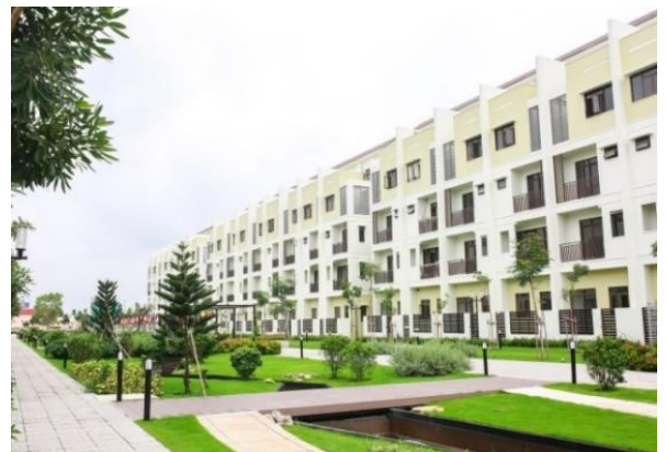
▲MIDORI PARK HARUKA