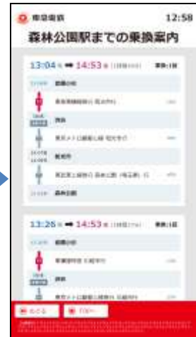
先着列車案内 検索結果