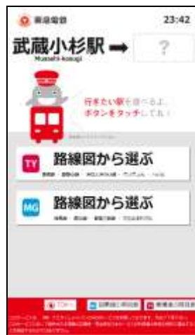
先着列車案内 TOP画面