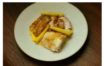
▲レストラン提供メニュー