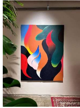
▲ Akari Uragami (シェアオフィス)