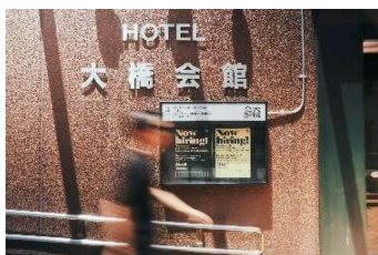
▲本施設エントランス

大橋会館は、東急グループがまちづくりを進める「広域渋谷圏 (Greater SHIBUYA)」内で、池尻大橋エリアがもつ独自性や人の繋がりを促進する施設となることを目指しております。また、ホテルレジデンスは、当社が展開する、コンセプト賃貸住宅「スタイリオX」シリーズの多拠点生活者向け賃貸住宅で、多様な生活様式にあわせた、自由で豊かな暮らしを提供することにより、東急グループのまちづくり戦略にて掲げる「渋谷型都市ライフ」の実現に貢献します。