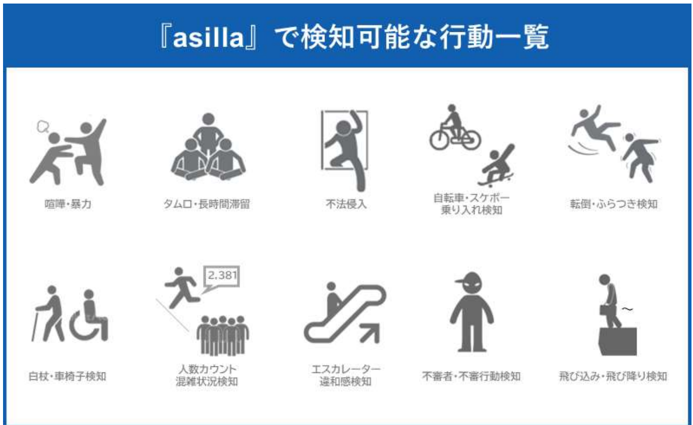
▲「asilla」で検知可能な行動一覧