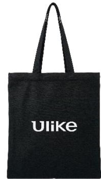
▲Ulike オリジナルエコバッグ