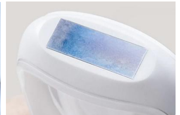
照射面のサファイアヘッドが肌を冷却