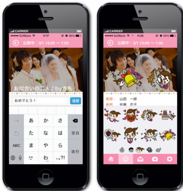
参加者側スマホアプリイメージ

式場内に設置されたスクリーンにリアルタイムにテキストメッセージやスタンプを送信したり、スマートフォンで撮影した動画をお祝いムービーとして送信する事が出来ます。