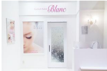
mozoワンダーシティビブレ店

所在地: 〒560-0082 大阪府豊中市新千里東町1-1-1 オトカリテ千里中央3F 電話: 06-6831-6996 営業時間: [日~木] 10:00 ~ 20:00(最終受付19:00) [金・土] 10:00 ~ 21:00(最終受付20:00)