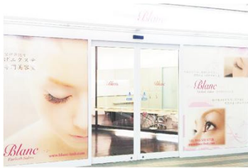
港北東急 S.C 店

所在地: 〒452-0817 名古屋市西区二方町40-226 mozoワンダーシティビブレ2F 電話: 052-982-8285 営業時間: 10:00~22:00(最終受付21:00)