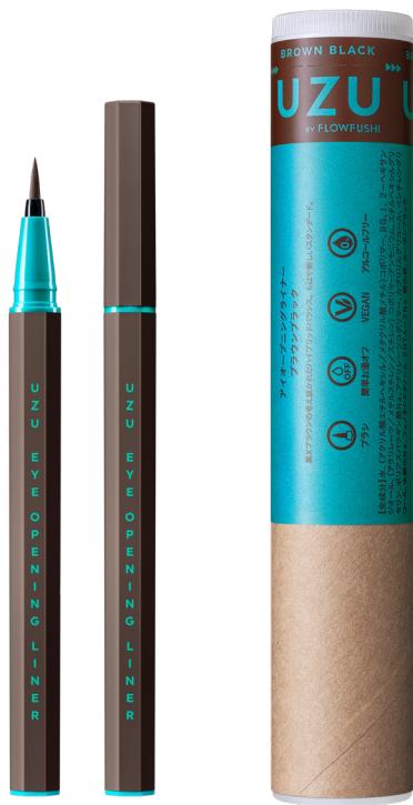
EYE OPENING LINER ブラウンブラック