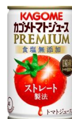
カゴメトマトジュースプレミアム 食塩無添加 160g ※8月21日(火)発売