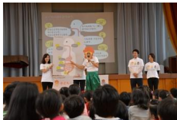
『おなかを元気にする授業』