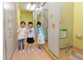
トイレ空間改善後②