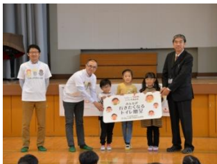
『みんなが行きたくなるトイレ』贈呈式