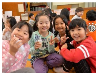
ラブレ菌を含む乳酸菌飲料の飲用