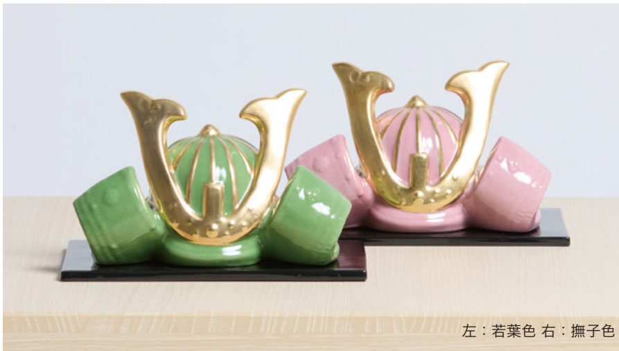
左：若葉色 右：撫子色

日本の伝統美をオリジナルなデザインで発信し続けるインテリアブランド AREA と、OBI PORCELAIN によるコラボレーション第 2 弾として、端午の節句飾り「五月兜」が誕生しました。