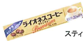
スティックタイプ