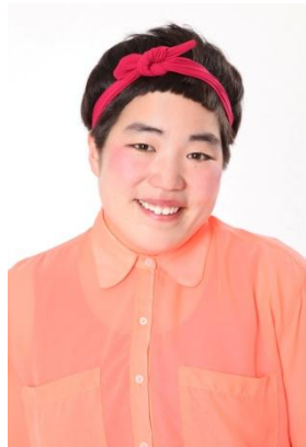
ゆりやんレトリィバァ