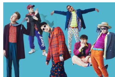
Beat Buddy Boi