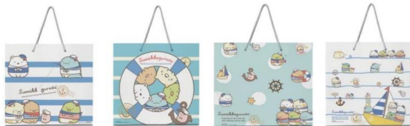
▲ ShionLe オリジナルショッピングバッグ 全4種 イメージ