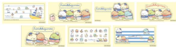
▲ ShionLe オリジナルステッカー 全7種 イメージ