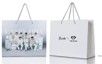
▲ ShionLe x TREASUREショッピングバッグ イメージ