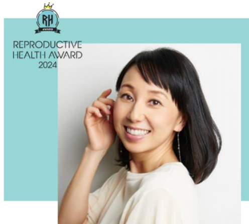
リプロダクティブヘルスアワード実行委員長

リプロダクティブヘルスの「健康的かつ、個人が尊重された生活の実現」は、私たち一人ひとりの幸福に直結しており、それをサポートする個人や団体、企業や商品・サービスの認知や価値を高めることが大切だと考えています。日本は、残念ながらリプロダクティブヘルスに対する社会全体の理解が進んでいるとは言えません。この重要なテーマに対する社会の理解と取り組みの推進を強く願っています。このアワードを通じて、多くの人々がリプロダクティブヘルスの意義を再認識し、自分と他者を尊重する健やかな社会の実現を目指して、共に新しい時代を築いていけるきっかけになればと思っています。