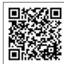
スポーツセンターウェブサイト

申込方法 (1) 電子申請(スポーツセンターウェブサイトからお申し込みください) (2) 電話、来所(県立スポーツセンター・藤沢市善行)、または下記「事前申込書」によりファクシミリでお申し込みください。