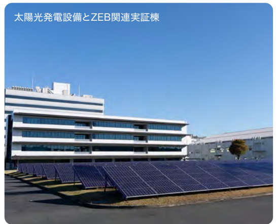
太陽光発電設備とZEB関連実証棟

鎌倉市内等の事業所において、再生可能エネルギーの導入を積極的に行うとともに、高効率な空調設備、変圧器、圧縮機等への更新や、自社で開発したZEB技術や電力監視技術を活用することで、事業所の省エネを推進している。また、ZEB技術のアピールも広く行っている。計画最終年度となる令和3年度は、これらの取組により基準年度(平成30年度)に対して約16%と、CO 2 排出量の大幅な削減を実現した。