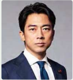
基調講演 / パネリスト 小泉 進次郎氏 (衆議院議員 元環境大臣)