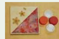
コースター ※画像はイメージです。