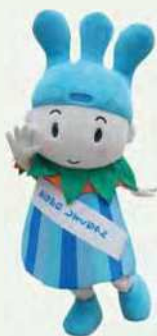
かながわしずくちゃん

10:30~11:00/12:00~12:30/13:30~14:00/15:00~15:30