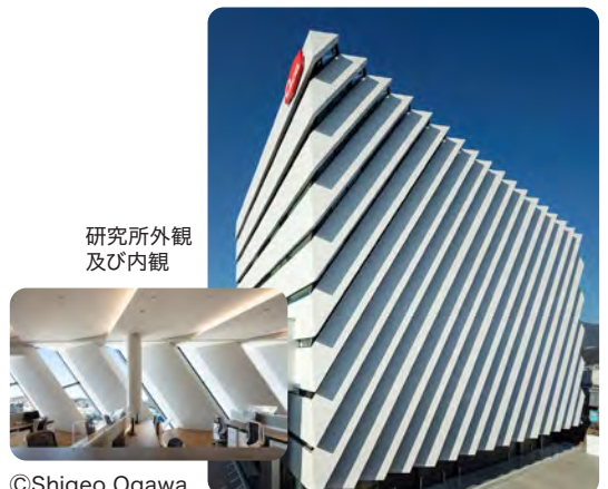
研究所外観 及び内観

令和2年に伊勢原市内に竣工した生命科学研究所新棟において、照明の自動制御や床吹出し方式の空調設備の採用等、室内環境向上に配慮するとともに、冷温水同時取出型チラーやデシカント空調機等の採用により、省エネルギーを図っている。さらに、用途別にエネルギー消費量を把握・分析可能な計画とし、節水器具やリサイクル材等を採用するなど、環境負荷削減に配慮し、県建築物温暖化対策計画書制度における評価システム(CASBEE ® )では最高のSランク評価となっている。