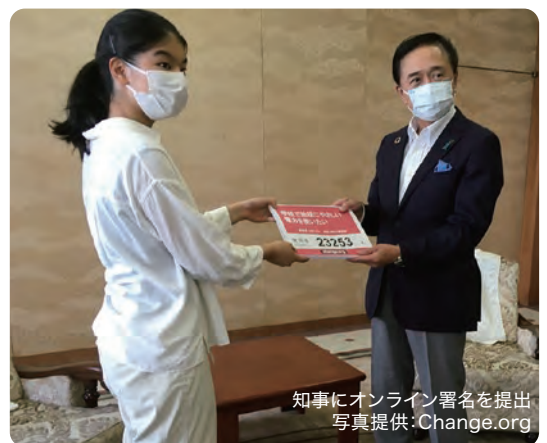
知事にオンライン署名を提出

高校生が脱炭素に関する問題意識をもち、自らできること及び効果的な手法を考えて行動に移したこの取組は、県立高校における再エネ電力導入の推進に対する後押しとなり、令和5年度には県内の全県立高校で再エネ由来の電力となった。