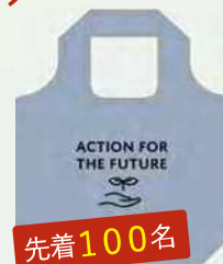
オリジナルエコバッグ

会場内の計6カ所でクイズラリーを実施します。すべてのポイントを巡り回答した方には参加賞をプレゼント。先着100名にはエコバッグをプレゼントします。