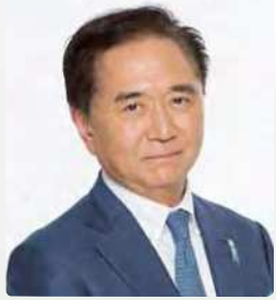
コーディネーター 黒岩 祐治 (神奈川県知事)