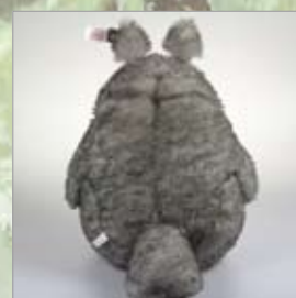
後からのアングル。