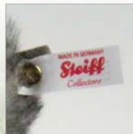
「白タグ+赤文字」限定品専用のタグが付きまます。