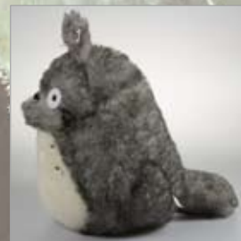
横からのアングル。