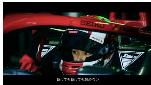
「負けても負けても諦めない」