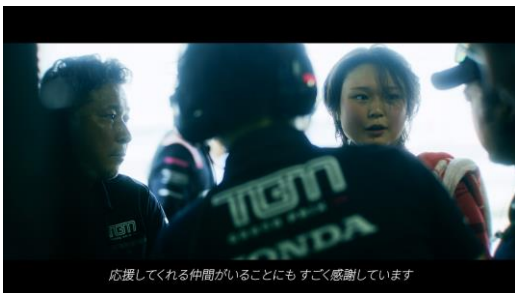
仲間やファンからの支えに感謝