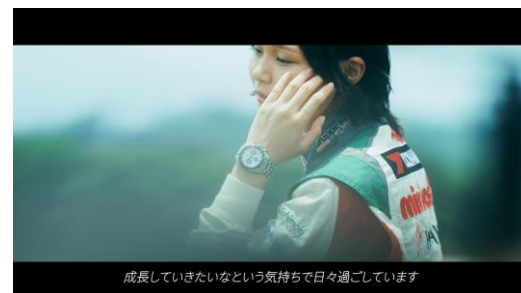
成長したい気持ちで日々を過ごす