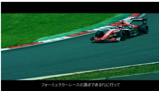
前人未踏の夢 "F1"の舞台に向けて