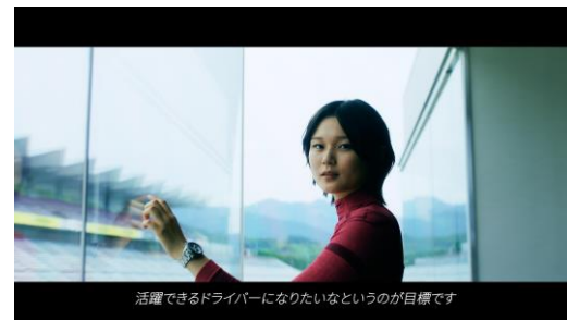
世界で活躍できるドライバーへ