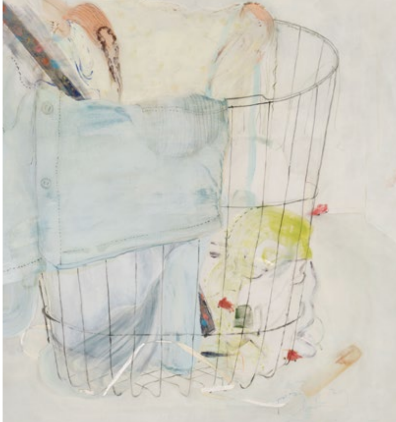
大賞 竹下麻衣「Laundry basketにて宝探しをする」