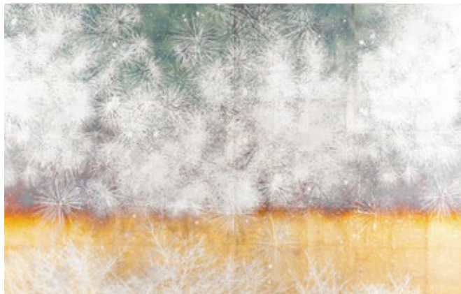
優秀賞 田口涼「Sound of Silver -万華-」