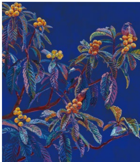
優秀賞 紫嵐「小満の飲」