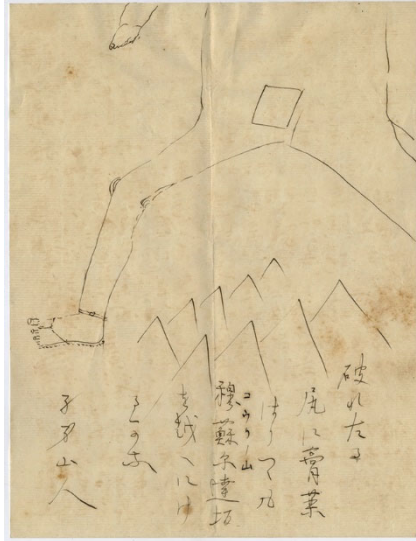
⑭大谷探検隊で現地から送付された 家族宛の書簡 大正2年11月24日付 ウルムチより (7葉の内の1葉) 吉川家