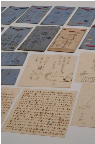
⑯大谷探検隊で現地から送付された 家族宛の書簡類 明治時代 吉川家