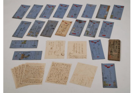
⑮大谷探検隊で現地から送付された 家族宛の書簡類 明治時代 吉川家