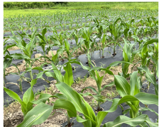
弊社の研究農場での大和ルージュ栽培風景

【メディア関係者の方へ】大和ルージュの青果は弊社の農場にて2022年10月中旬から下旬収穫予定です。この期間にご来社いただければ栽培風景や青果物をご覧いただけます。ご来社できない場合は収穫時期であれば青果をサンプルでお送りさせていただきますので、取材をご希望の媒体社様はお気軽にお問合せください。