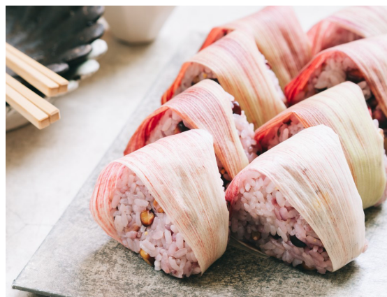
大和ルーージュのとうもろこしご飯

大和ルーージュは、トウモロコシの実だけではなく、芯やヒゲまで赤いのが特徴です。オススメの食べ方はレンジでチン！皮を少し残して電子レンジ(500W)で4分加熱すると、旨みが逃げず、茹でるより濃厚な味わいに。皮がない場合はラップでもOKです。アントシアニンは水溶性で水に溶ける性質を持っており、茹でると赤色や成分が溶け出してしまうので、茹でずにレンジか蒸したり焼いたりするのがオススメです。