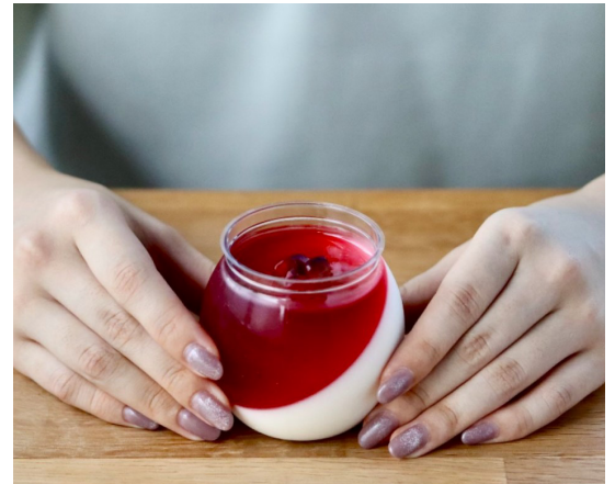
大和ルージュのパンナコッタ