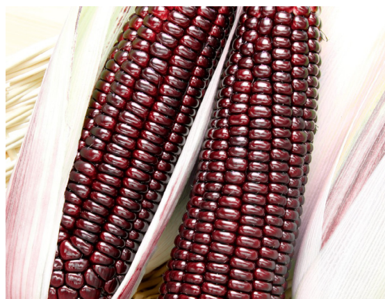
大和ルーージュの青果

「誰もが手に取って笑顔になる野菜を開発したい」という想いで『大和ルーージュ』は誕生しました。スイートコーン(甘味種)といえば、ほとんどが黄色で、その他は白色やバイカラーがありますが、スイートコーンで赤色のものはまだありませんでした。そのような中、今回は日本で初めてとなる“赤色”のスイートコーン『大和ルーージュ』の種子を開発。まるで宝石のように輝く赤い果実と、サツマイモのように優しい甘さでトウモロコシの風味と旨みが魅力の『大和ルーージュ』をぜひお楽しみください。