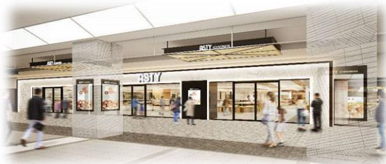
コンコースに面したメインファサード