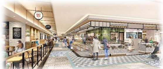
お買い物ができる、明るく居心地の良い空間