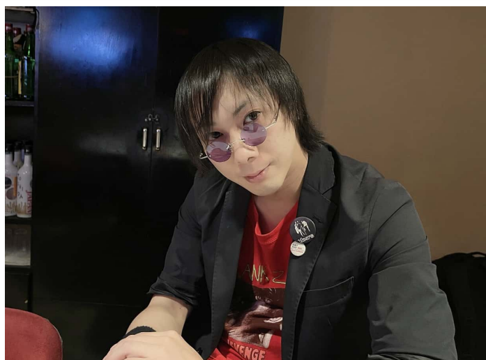
〈水野ウバ ( Photograph/Marilyn )〉