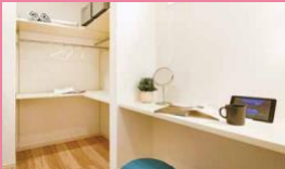
ランドリールーム

より快適な子育てライフを実現にする為に、必要な設備をカスタマイズできます。テレワークスペースや家事で役立つランドリースペースはもちろんのこと、自由に描いたり、家族の掲示板として活用できるひらめきキャンパスなどお子様もうれしい設備のオプションもございます。