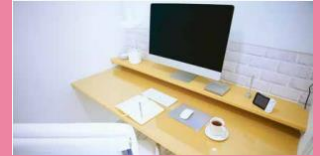
スタディースペース