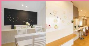
ひらめきキャンパス