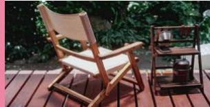
オープンテラス& ウッドデッキ