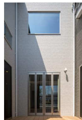
△中庭ウッドデッキ