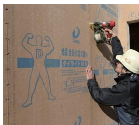
「ダイライト」施工イメージ