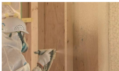
ウレタン吹付け施工イメージ

また、効率的な換気システムの導入により、湿気を防ぎつつ、良好な空気環境を維持します。さらに、壁材には耐力面材「ダイライト」を使用。地震による水平荷重を「面」で吸収させ、耐震性能を強化しています。