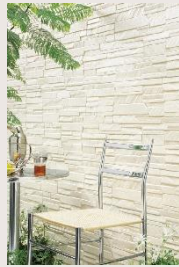
外壁 (15mmサイディング)