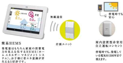
△簡易HEMS・非常用コンセント（一例）

※機器は取付業者による仕様となります。掲載商品から変更となる場合が御座います。※太陽光発電システムのサービス利用期間（10年間）は月額利用料がかかります。