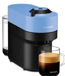
GDV2-BL-W パシフィックブルー 17,600円(税込価格)