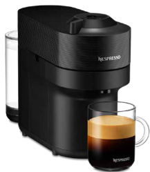
GDV2-BK-W リコリスブラック 17,600円(税込価格)