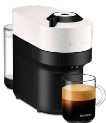
GCV2-WH-W ココナッツホワイト 17,600円(税込価格)

ネスプレッソ公式 楽天市場店、ネスプレッソ公式 Yahoo!ショッピング店、アマゾン、家電量販店 等