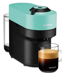
GCV2-AQ-W アクアミント 17,600円(税込価格)