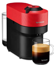
GCV2-RE-W スパイシーレッド 17,600円(税込価格)