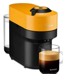
GDV2-YE-W マンゴイエロー 17,600円(税込価格)