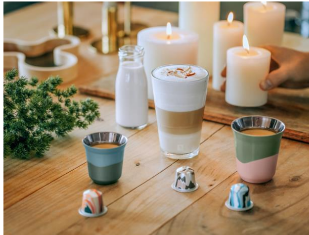
左から「ノルディック・クラウドベリー・フレーバー」、「ノルディック・アーモンドケーキ・フレーバー」、「ノルディック・ブラック」 (写真は飲み方例です。カプセルに乳は含まれておりません。)

カプセルコーヒー、専用コーヒーメーカー、“至福のコーヒー体験”をお届けするためのトータルサポートを提供することにこだわり続けてきた「NESPRESSO(ネスプレッソ)」(ネスプレッソ株式会社 本社:東京都品川区、代表取締役社長:パスカル・ルバイー)は、北欧の文化からインスピレーションを受けてつくられた冬の数量限定コーヒー3種類を、11月6日(水)より販売します。北欧の伝統的なお菓子の風味を想わせる2種類のフレーバーコーヒーと、1種類のルンゴコーヒーの味わいととも、大切な人と過ごす贅沢なひとときをお楽しみください。