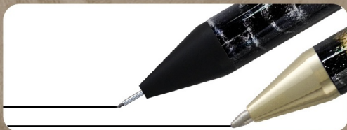
0.5mm ゲルインクペン&シャープペンシル