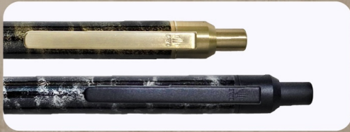
低鉛真鍮とメタルカラーの配色