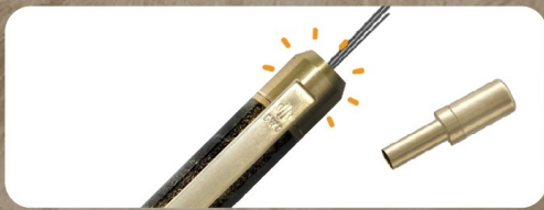
プッシュボタンを取り外せば、替芯を補充できます