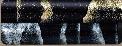
流れるような漆塗りの技法