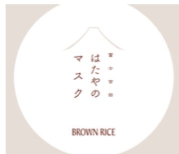
パッケージイメージ