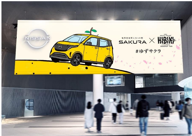
▲ゆずの世界観の中を走行する「ゆずサクラ」※画像はイメージです。

9月23日(土)より、日産グローバル本社ギャラリーの2階通路にて、計3種類の「#ゆずサクラ」ビジュアルを掲出中です。