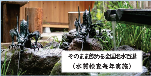
そのまま飲める全国名水百選 (水質検査毎年実施)