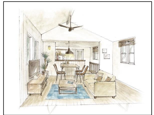
PALM HOUSE イメージ③

ブランド名の通り、カリフォルニアを象徴するヤシの木（パームツリー）を1棟ごとに植えており、玄関から道路までの距離をしっかりと確保したオープンなプライベートスペースは、駐車スペースとしてだけでなく、BBQやハンモックなど、趣味のスペースとしても活用できます。