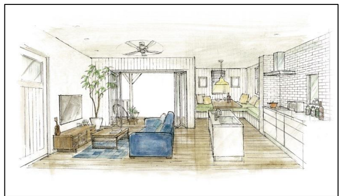
PALM HOUSE イメージ②

「カリフォルニア工務店」は、2009年に柵(えい)出版社の建築デザイン事務所として誕生して以来、サーフィン、バイク、アメリカンカルチャーといった雑誌の世界観をそのまま物件に反映させ、全国の住宅・インテリアにこだわりを持つ多くのファンから支持されています。