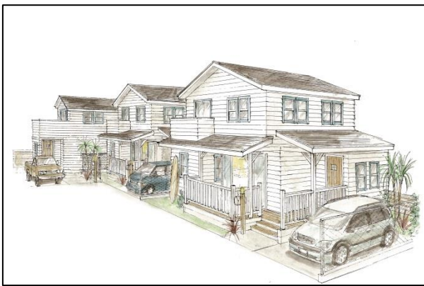
PALM HOUSE イメージ①