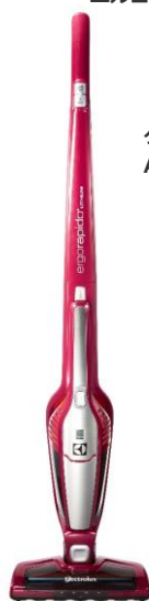
【スティック掃除機】 エレクトロラックス エルゴラピード・リチウム