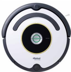
【ロボット掃除機】 アイロボット ルンバ 622