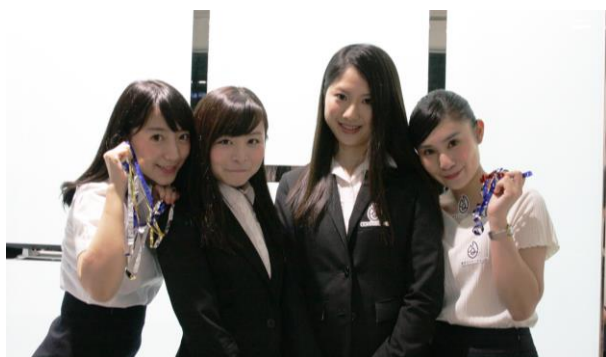
1期生で新アド生でもある さや、ななほと共に