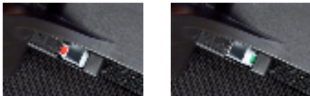
コネクターロック部