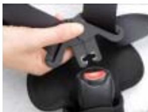
マグネットタング&自立バックル