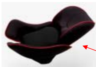
ニューボーンプロテクトクッション