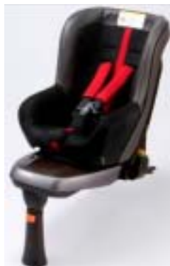
takata04- i fix (タカタゼロヨンアイフィックス) leather selection

タカタでは、ISOFIXチャイルドシートの普及で、国内のチャイルドシートのミスユースを減らすとともに、チャイルドシート使用率の拡大にも寄与したいと考えています。