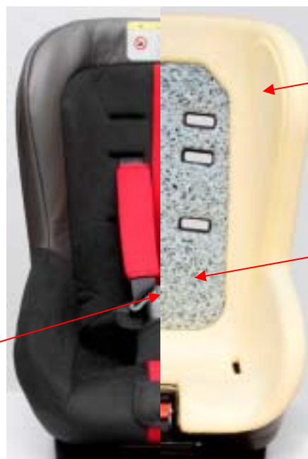
サイドプロテクション