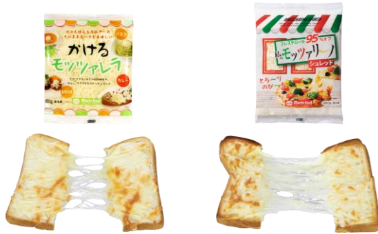
<かけるモッツアレラ(チーズ 100%)と私のモッツァリーノ(スティリーノ)伸びの比較>