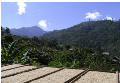
グアテマラ アソバグリ農協