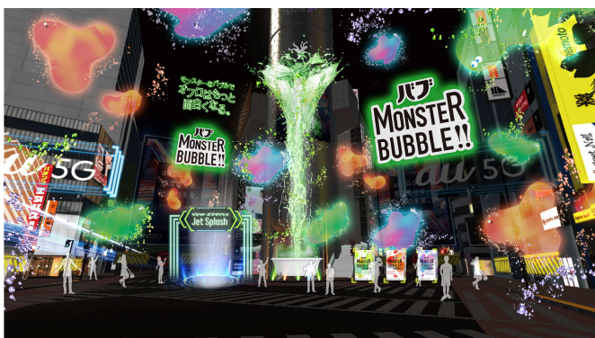
「Jet Splash (ジェットスプラッシュ)」 イメージ

スプラッシュによってまるでフリーフォールのように上がったたり下がったりしながら、普段はなかなか見ることのできない視点から渋谷の街を見下ろせる、メタバース空間ならではのエキサイティングな爽快体験ができるコンテンツです。