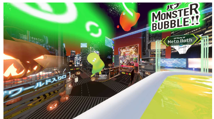
「Meta Bath (メタバス)」 体験者視点イメージ