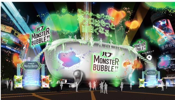
「Meta Bath (メタバス)」 イメージ

バーチャル渋谷の象徴、スランブル交差点に、まさに“モンスター級”の巨大バスタブが出現。『バブ MONSTER BUBBLE』の炭酸のジェット発泡や、緑・青・赤と色とりどりに変わる湯面とともに、ハロウィーン一色となる渋谷の街並みを一望しながら、幻想的なオフロ時間を楽しむことができます。