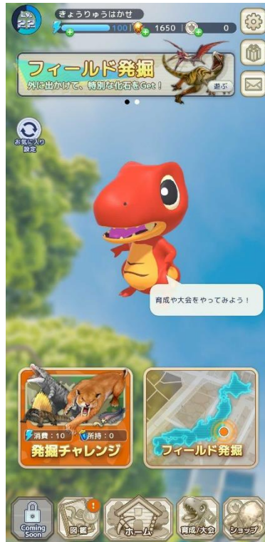
▲アプリホーム画面