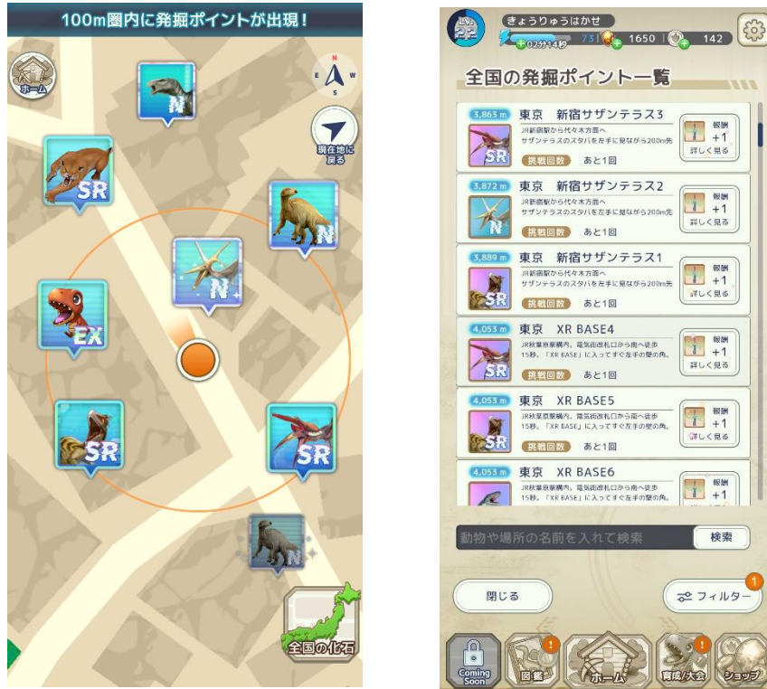
▲フィールド発掘マップ画面