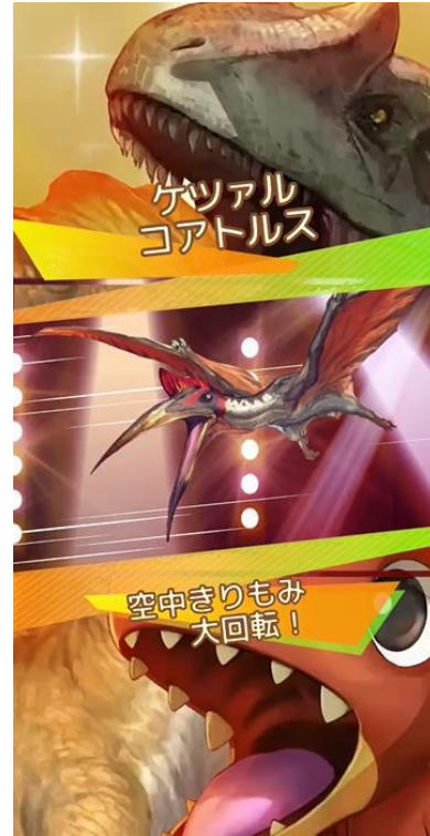
▲大会ダンスバトルイメージ