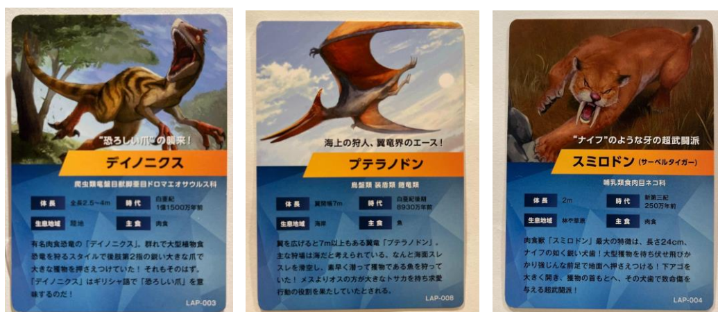
古生物カード（画像は一部）

ARで体験いただける他、アプリをダウンロードしてくださったお客さまを対象に恐竜などの古生物カードが必ずもらえるカプセルトイを8月より設置します。※4