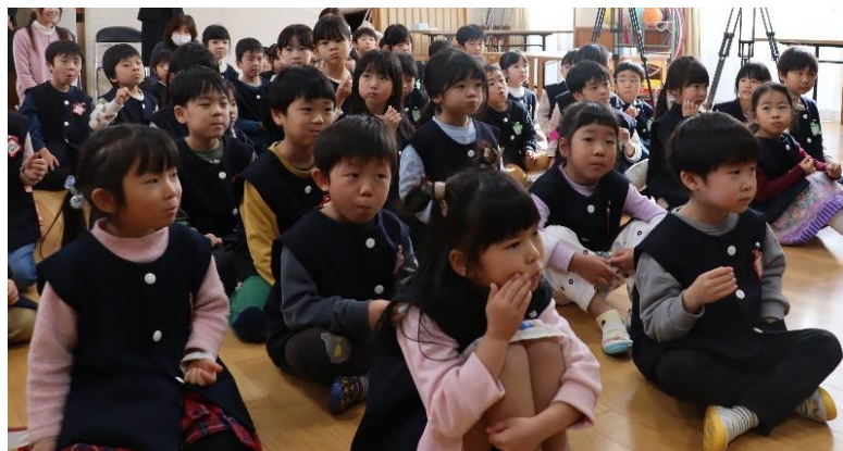
ガムを噛んでいる園児