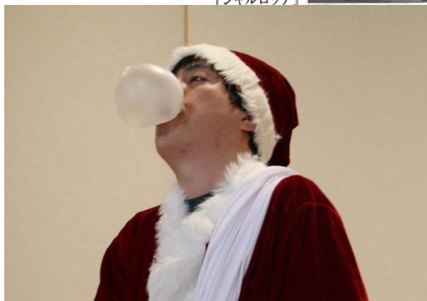
大きなフーセンガムを披露するフーセンガム名人