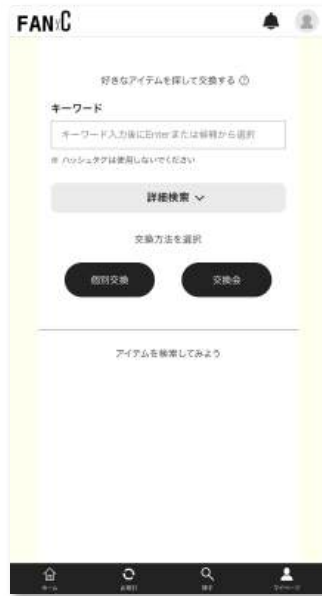
1.欲しいアイテム検索