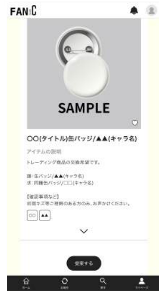
2.求しいアイテムを選択