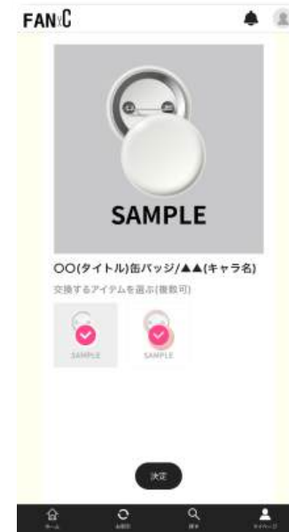
3.譲るアイテムを選択