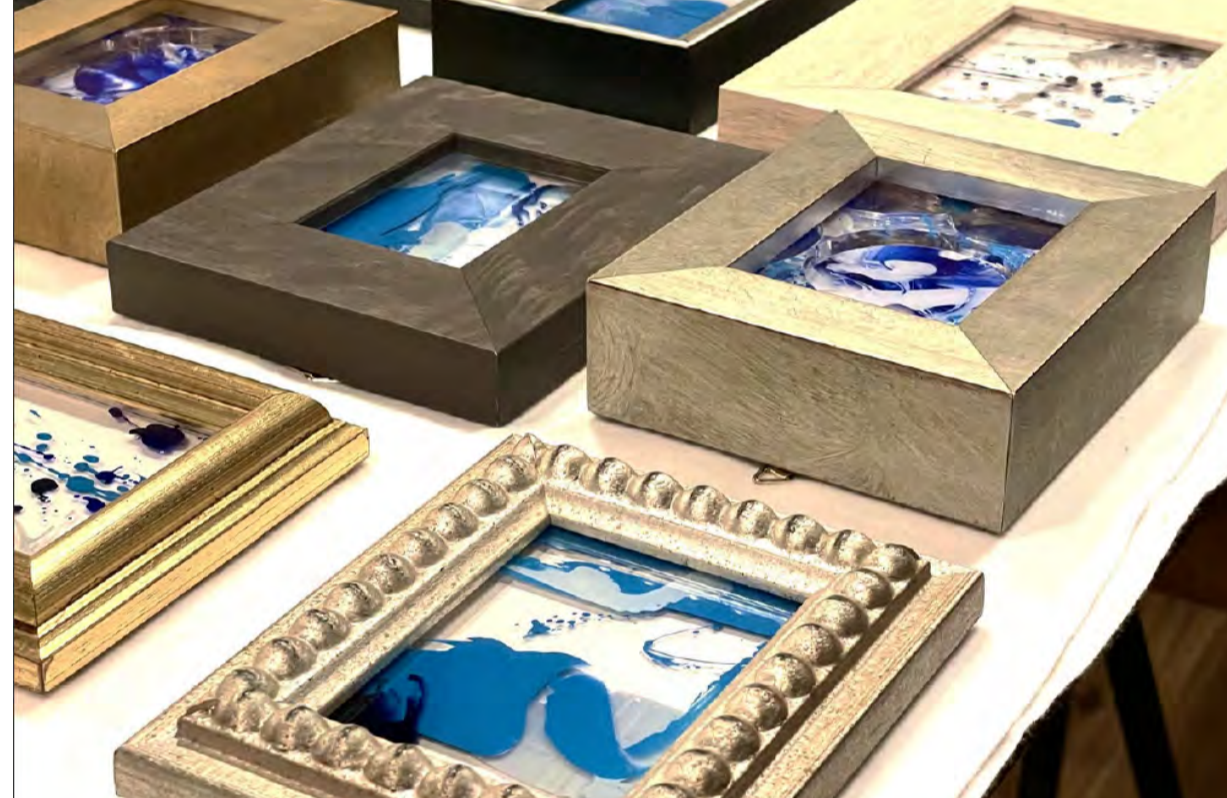
化粧品のネイル等を再利用したペイントシリーズ