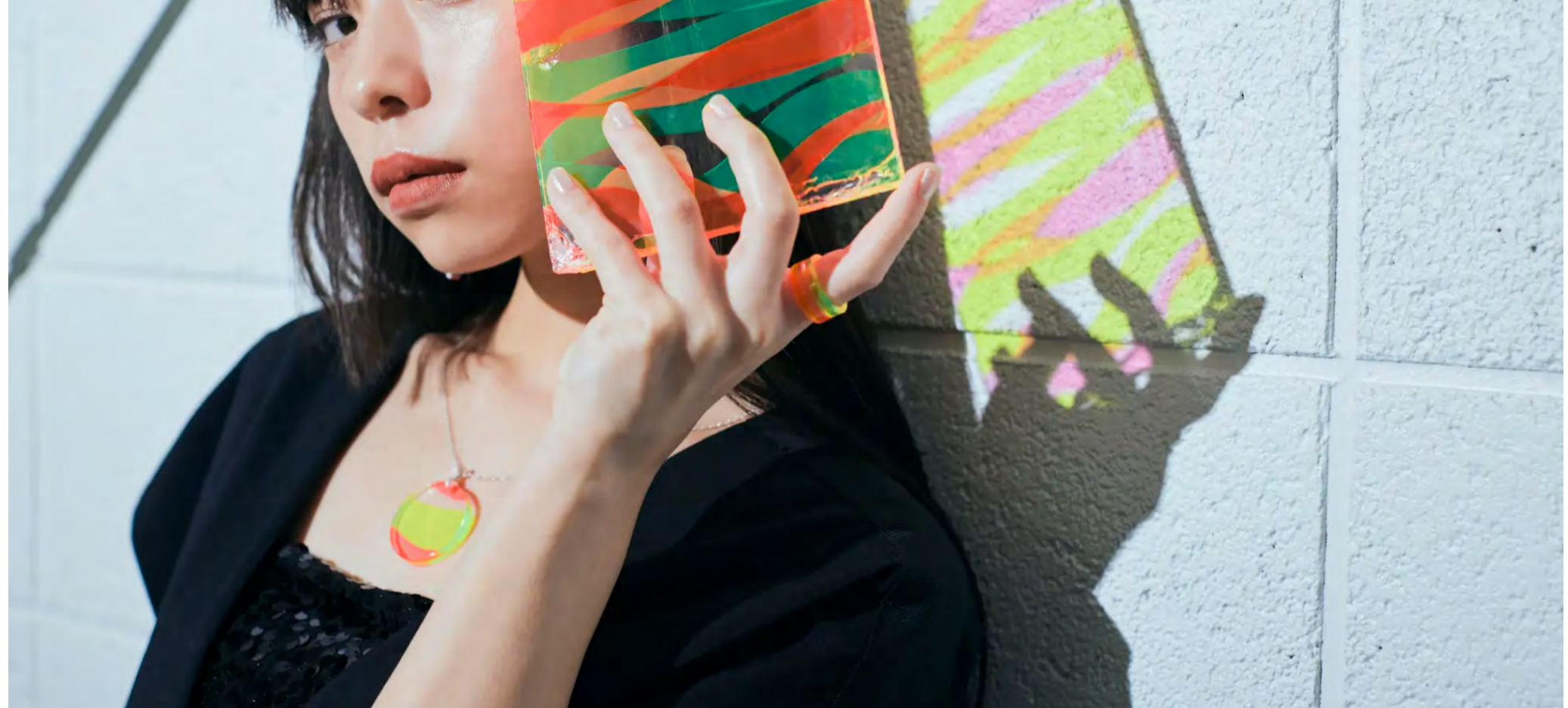
蛍光色の端材をミックスしてできるNeonシリーズ