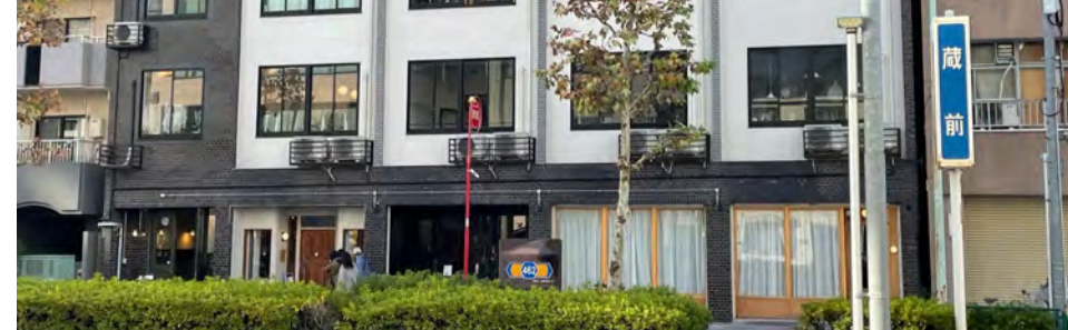
ウグイスビルの外観

入居を決めたのは「ウグイスビル」という築約70年のレトロビルをリノベーションした建物です。居抜きのため、現状回復が不要で、お店のオープン時に廃材がほとんど出ることはありません。「古いので壊す」ではなく「古いから生かす」という考え方が根付いています。古さに惹かれて集まる素敵なお店を楽しめる建物です。