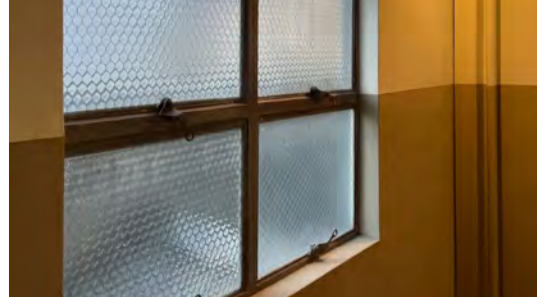
雰囲気のある窓や照明