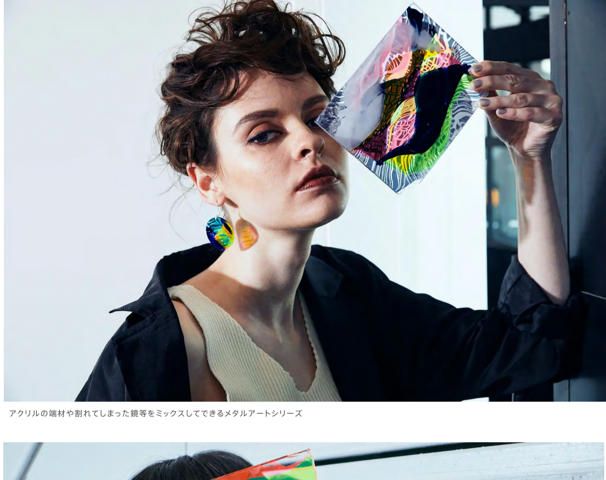
アクリルの端材や割ってしまった鏡等をミックスしてできるメタルアートシリーズ

アクリルをメインに鏡、木、紙、糸、布、化粧品、コーヒー豆、海洋プラスチック等の廃材をアップサイクルし製品化、販売しています。アップサイクル時にあえて着色等はせず、役目の終えた素材の持つ色味や質感、偶然できる重なりを活かし、一点ものの製品として新しい命を吹き込んでいます。