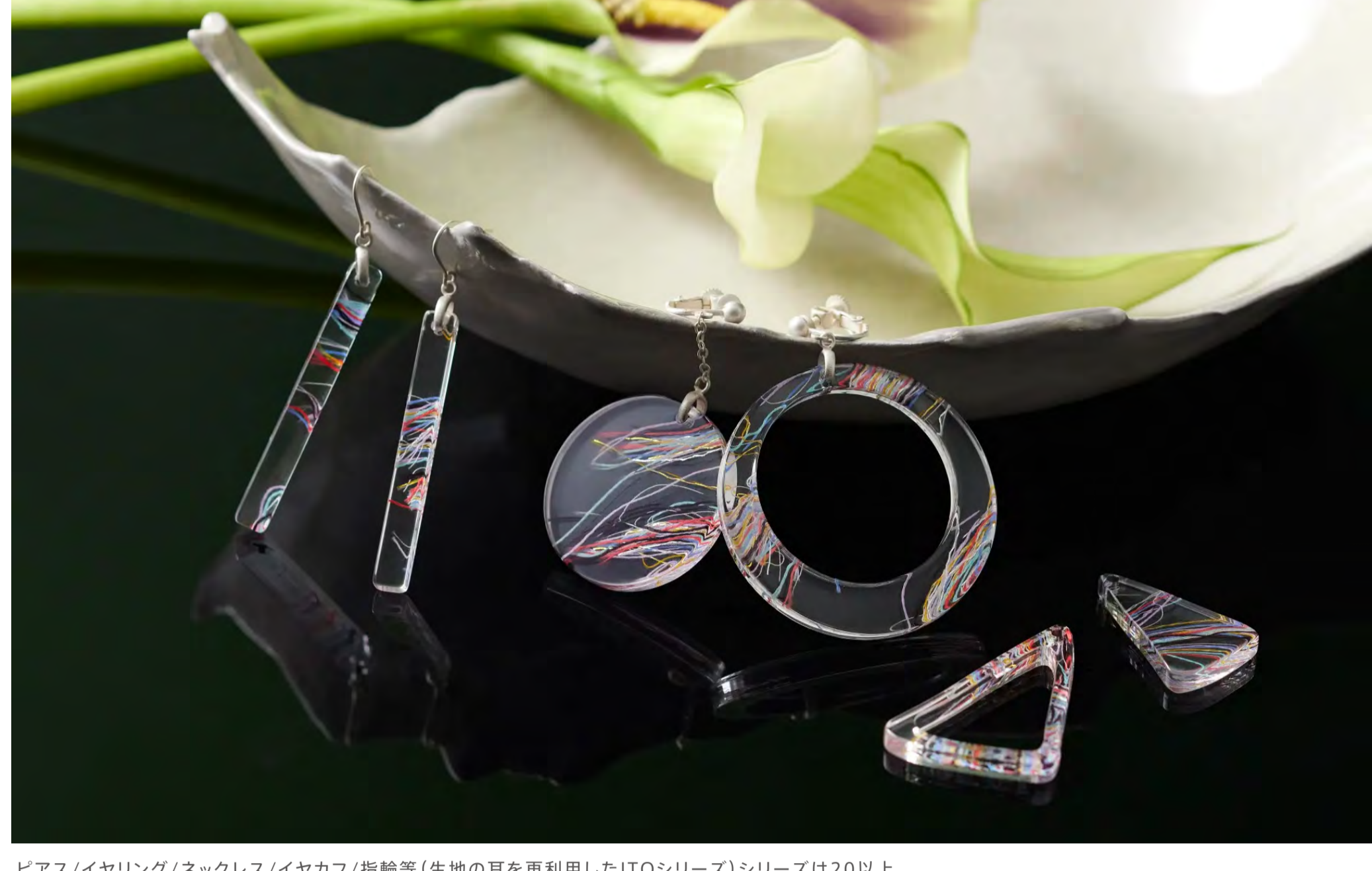
ピアス/イヤリング/ネックレス/イヤカフ/指輪等(生地の耳を再利用したITOシリーズ)シリーズは20以上