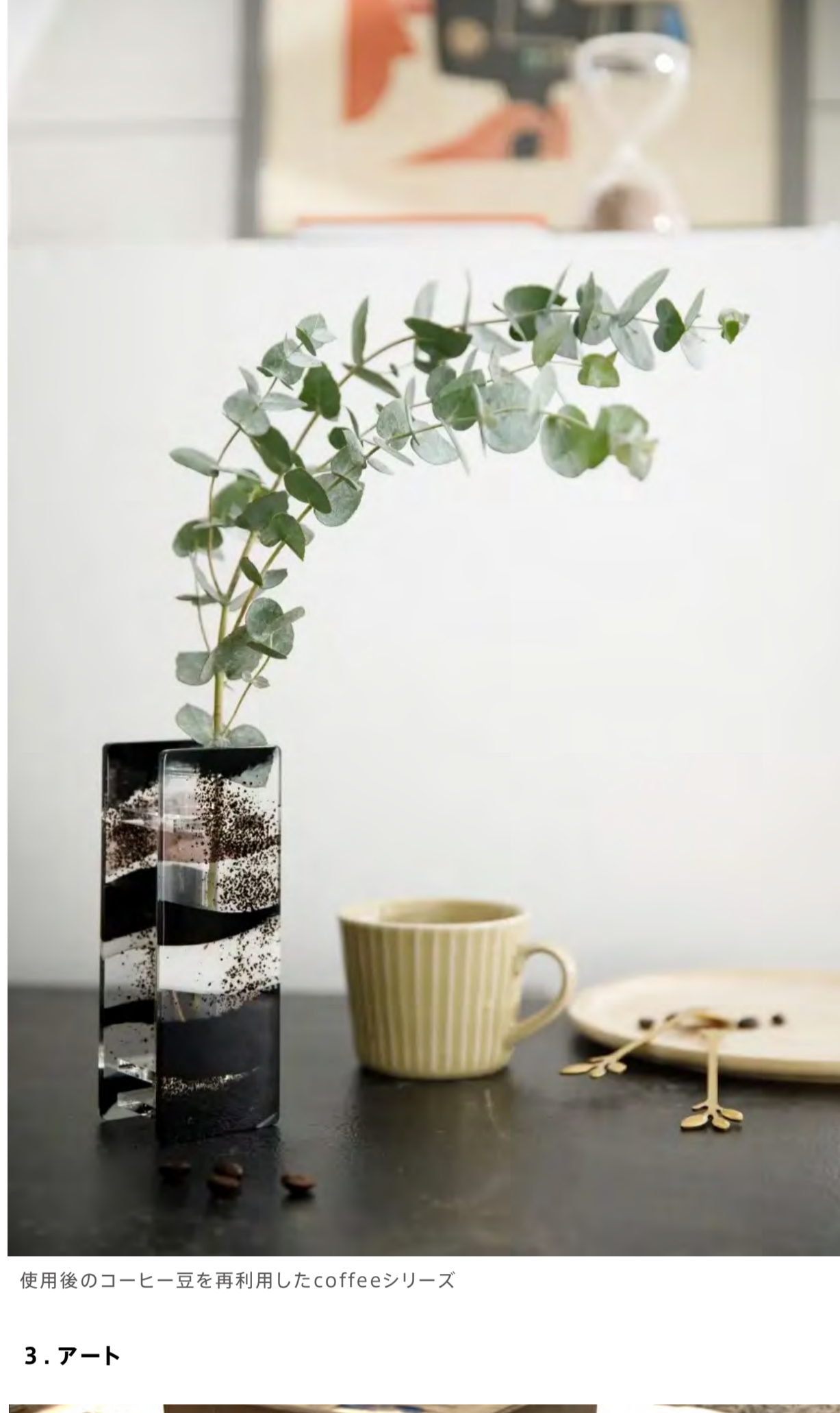
使用後のコーヒー豆を再利用したcoffeeシリーズ