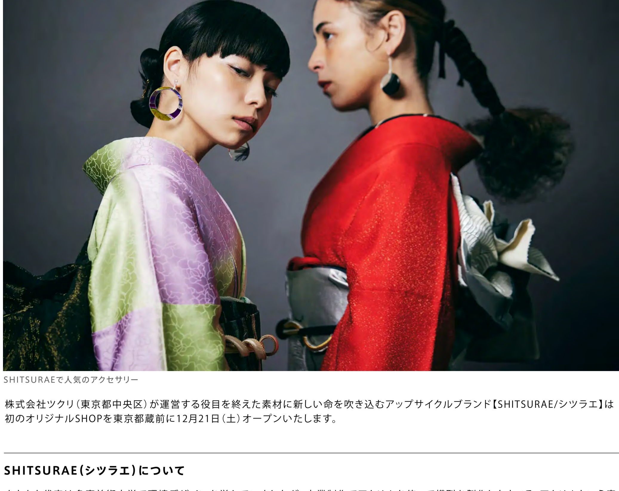
SHITSURAEで人気のアクセサリ

役目を終えた素材に新しい命を吹き込むアップサイクルブランド【SHITSURAE/シツラエ】、初のオリジナルSHOPを東京都蔵前に12月21日(土)オープン!コロナ禍で使用されたアクリルパーテーションを廃棄させないために、2020年に立ち上げたSHITSURAE。その透明度を活かし、様々な役目を終えた素材を組み合わせた1点モノのアップサイクル製品を販売!