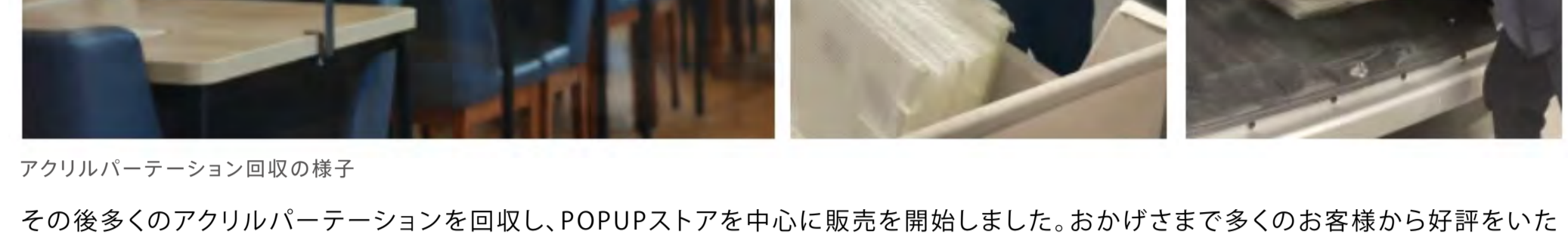
アクリルパーテーション回収の様子

(2021年時点でコロナ対策として使われた飛沫防止用のアクリル製パーテーションが国内だけでも300万枚あると推定される)