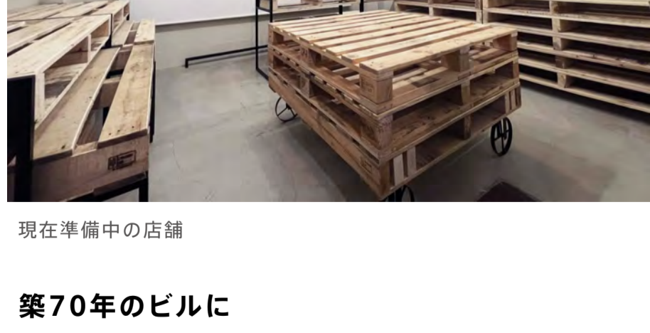
現在準備中の店舗

店舗で使用する什器や家具もアップサイクルです。年間廃棄量は、約3,500万枚以上といわれる木製のパレットを再利用した什器、跳び箱を再利用した椅子等、新品ではでない風合いを楽しめます。