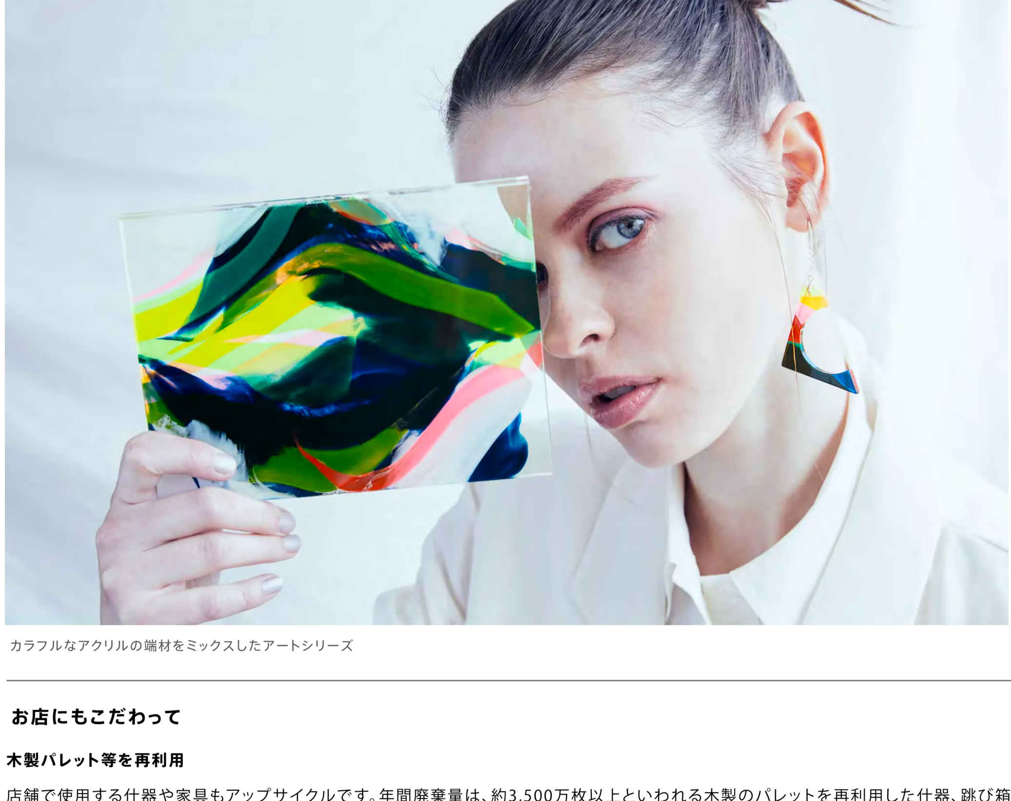
カラフルなアクリルの端材をミックスしたアートシリーズ