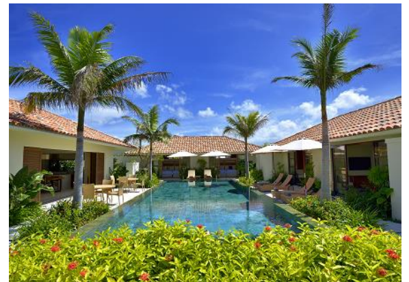
沖縄 ジ・ウザテラス ビーチクラブヴィラズ（読谷村）