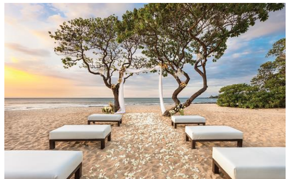
ハワイ フォーシーズンズ・リゾート・フアラライ・アット・ヒストリック・カウプレフ（ハワイ島）

また、「PLATINUM BIRTHY」は、これまで東京・南青山の専用ラウンジでのみご案内していましたが、より多くの方に「PLATINUM BIRTHY」のウェディングをご提案したいという思いから、関西エリア（大阪・京都・神戸など）を対象にした出張相談をスタートします。また、7月14日（土）7月22日（日）に名古屋「ワタベウェディング名駅サロン」で、7月7日（土）7月15日（日）7月28日（土）に東京・南青山「プラチナバーシー専用ラウンジ」で、ブライダルフェアも行います。